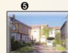
Musée J Blanchet rue des 3 ponts (p.19)