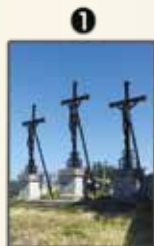
Calvaire (p. 14-15)