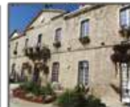
Hôtel-de-Ville (p. 23)