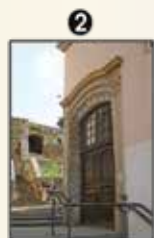
Collège Victor de Laprade (p. 20)