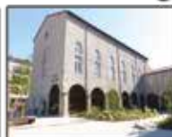
Office de tourisme Loire Forez (p. 23)