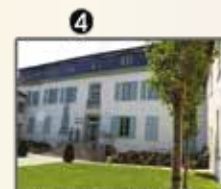
Musée d'Allard (p. 16-17)