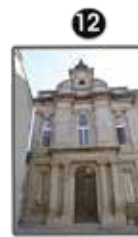
Théâtre des Pénitents (p. 7)