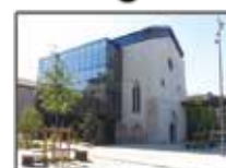
Médiathèque Loire Forez (p. 23)