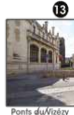
Ponts du Vizèzy (p. 4)