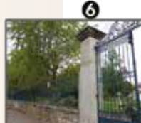
Jardin d'Allard (p.6)