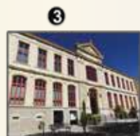
Loire Forez agglomération (p. 23)