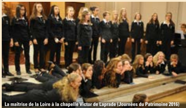
La maîtrise de la Loire à la chapelle Victor de Laprade (Journées du Patrimoine 2016)

Nombreuses animations proposées autour du thème jeunesse et patrimoine.