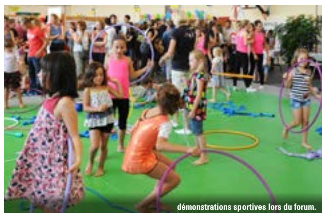
démonstrations sportives lors du forum.

Plus d'une centaine d'associations sont déjà annoncées et proposeront au public de découvrir l'immense richesse du tissu associatif montbrisonnais mais permettront également de s'inscrire aux activités pour les enfants, les adolescents ou les adultes.