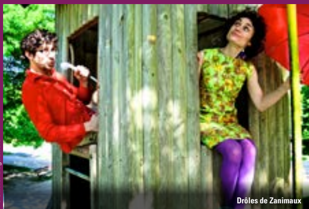
Drôles de Zanimaux