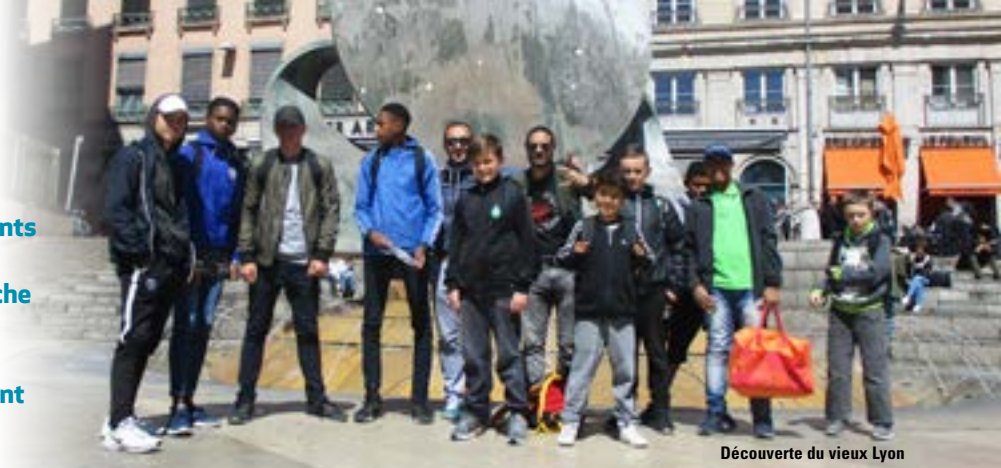
Découverte du vieux Lyon

En trois ans, la ville a multiplié les initiatives en direction des adolescents avec la création d'un espace d'animations et d'activités, l'embauche d'un animateur et la création du comité jeunesse pour qu'ils mettent eux même la main à la pâte en prenant des initiatives et en participant à l'organisation de leurs activités.