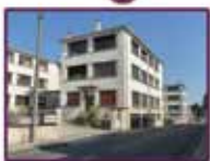
Ancienne usine GEGÉ (p. 19)