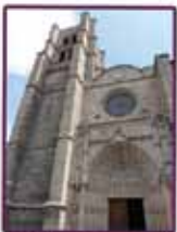
Collégiale (p. 15)