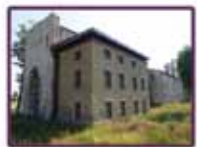
Clos Sainte-Eugénie (p. 6-7)