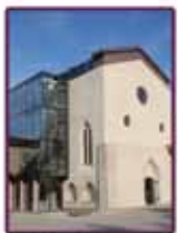
Médiathèque Loire Forez (p. 17)