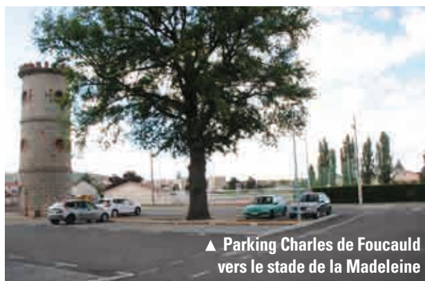
▲ Parking Charles de Foucauld vers le stade de la Madeleine