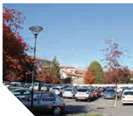
▲ Parking Saint-Jean

Il y a plus de dix ans, les municipalités s'étaient attachées à bien organiser le stationnement à Montbrison en mettant en zone bleue les rues du centre ville et en aménageant des parkings gratuits et sans limite de temps dans la périphérie. Ainsi les parkings de la Gare, du Parc des Comtes, Saint Jean, Jean Vial, Ecotay et près des ensembles sportifs, étaient venus compléter le stationnement sur les contre-allées des boulevards. L'attractivité de la ville nous a conduit à poursuivre leur dynamique.