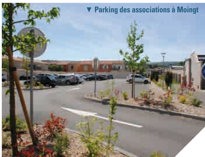
▼ Parking des associations à Moingt