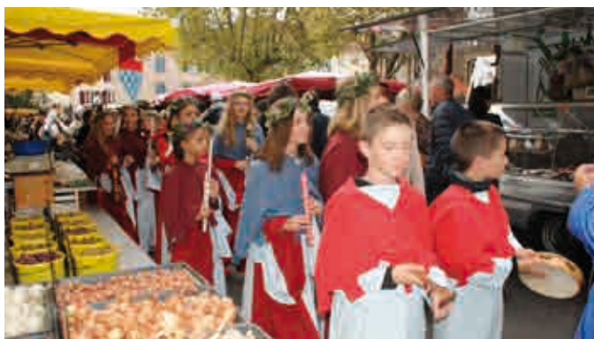
▲ Les jeunes musiciens du GAMM à l'heure médiévale

personnes ont participé aux visites organisées sur le site de Sainte-Eugénie à Moingt et ils étaient plus de 400 à se précipiter dans les locaux des anciennes usines Gégé pour la seule après-midi de dimanche.