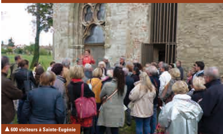
▲ 600 visiteurs à Sainte-Eugénie