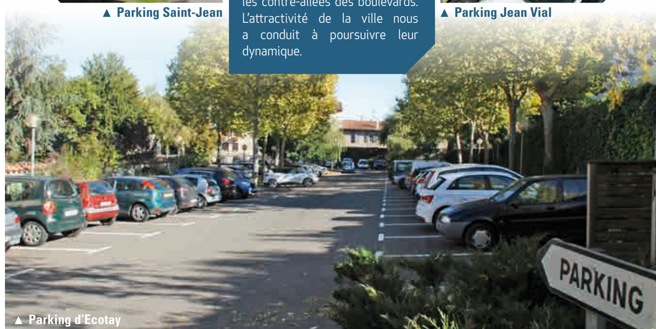
▲ Parking d'Ecotay