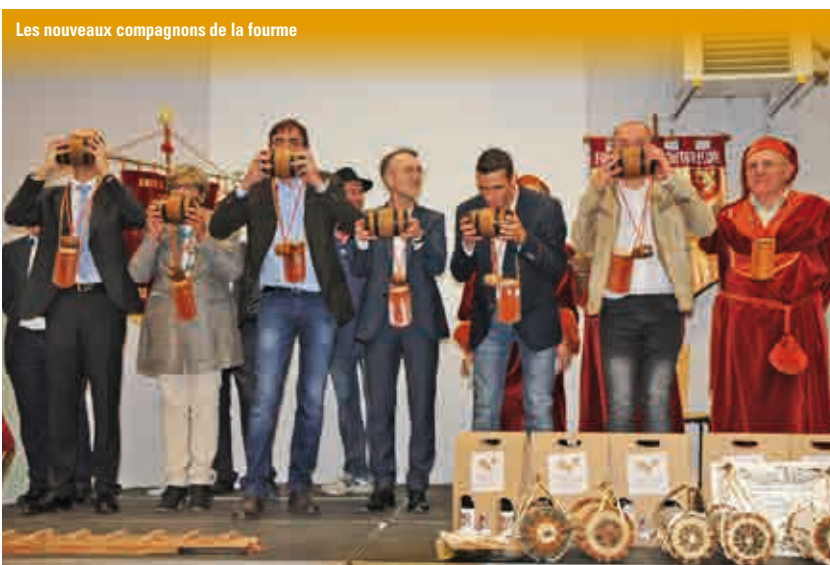
Les nouveaux compagnons de la fourme