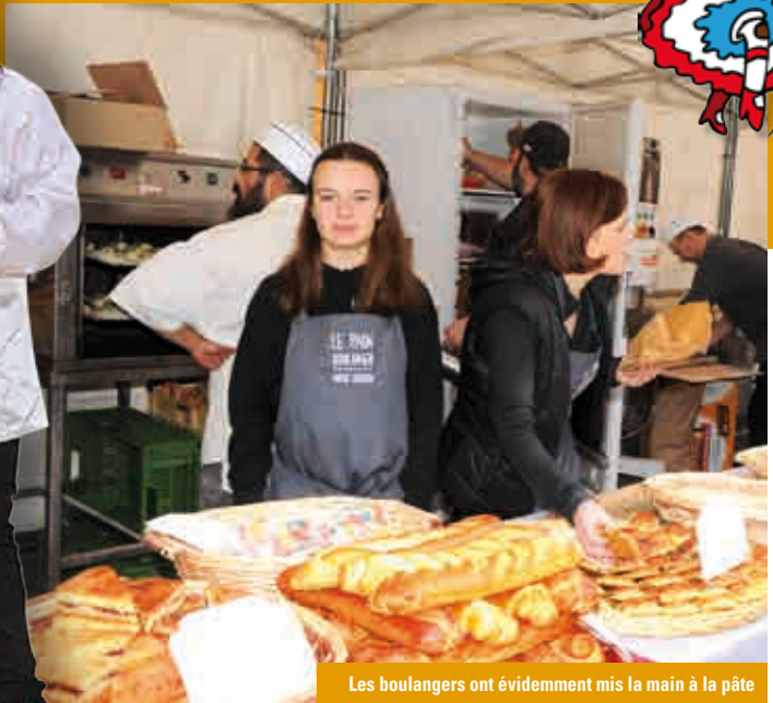
Les boulangers ont évidemment mis la main à la pâte