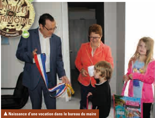
▲ Naissance d'une vocation dans le bureau du maire