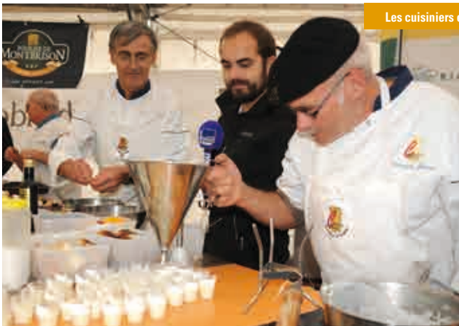
Les cuisiniers en démonstration