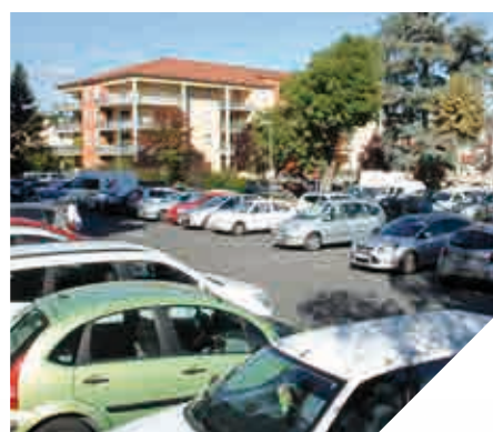
▲ Parking Jean Vial

Il y a plus de dix ans, les municipalités s'étaient attachées à bien organiser le stationnement à Montbrison en mettant en zone bleue les rues du centre ville et en aménageant des parkings gratuits et sans limite de temps dans la périphérie. Ainsi les parkings de la Gare, du Parc des Comtes, Saint Jean, Jean Vial, Ecotay et près des ensembles sportifs, étaient venus compléter le stationnement sur les contre-allées des boulevards. L'attractivité de la ville nous a conduit à poursuivre leur dynamique.