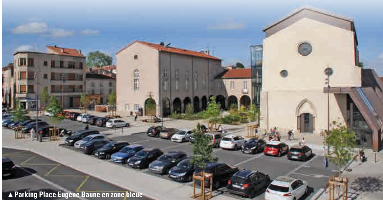
▲ Parking Place Eugène Baune en zone bleue

Du coup, à la place de la Mairie qui restera en zone bleue, s'ajouteront désormais la place Eugène Baune, les quais du Vizézy et le parking de la Commanderie.