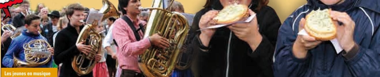
Les jeunes en musique