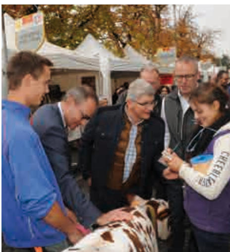
La fête de la fourme ce sont aussi les contacts avec le monde agricole