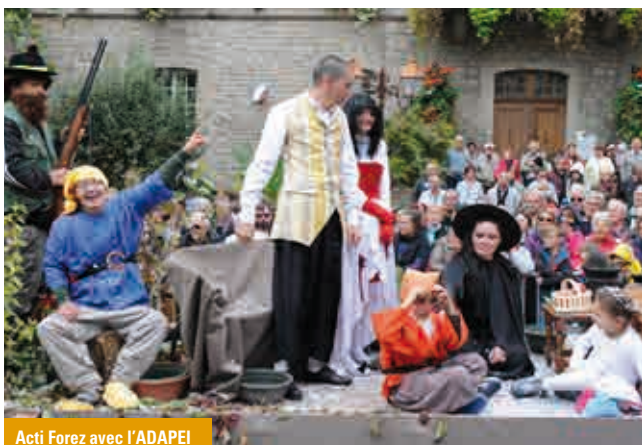
Acti Forez avec l'ADAPEI