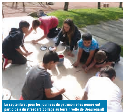
En septembre : pour les journées du patrimoine les jeunes ont participé à du street art (collage au terrain volle de Beauregard)

De retour à Montbrison, le programme de l'été a permis à une cinquantaine d'adolescents de pratiquer le rafting, le kart de descente ou le canoë. Des animations sur la ville ont également été proposées en partenariat avec d'autres structures jeunesse. Rendez-vous est d'ores et déjà donné à tous les jeunes de la ville pour les prochaines vacances.