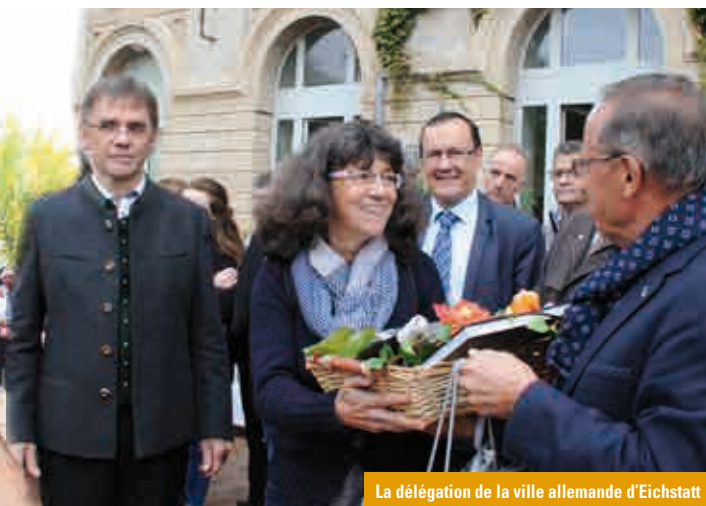
La délégation de la ville allemande d'Eichstatt