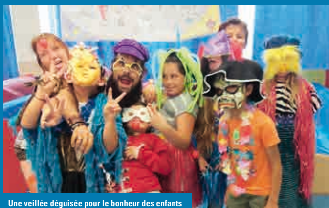
Une veillée déguisée pour le bonheur des enfants

Du 10 juillet au 1 er septembre, ce ne sont pas moins de 60 enfants de 3 à 11 ans qui ont vécu chaque semaine de leurs vacances avec Marty, Alex, Melman et Gloria, les héros du film « Madagascar ». Encadrés par une dizaine d'animateurs et animatrices, chaque enfant a profité des activités manuelles, culturelles et sportives proposées mais également de la fraîcheur de la piscine Aqualude et du plan d'eau de Saint Anthème, de sorties dans les zoos de la région et des soirées veillées au centre.