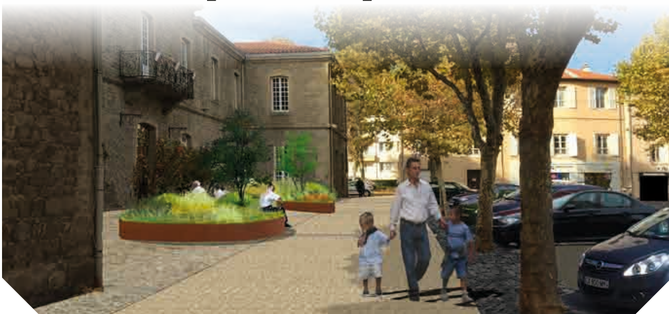
▲ Futur parking de la place de l'Hôtel de Ville