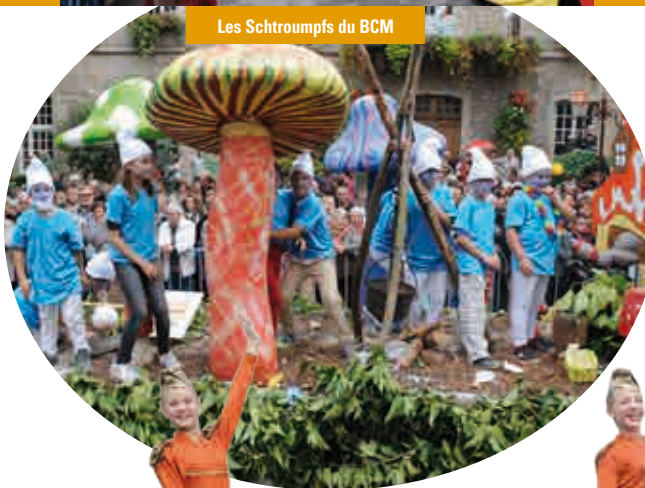
Les Schtroumps du BCM