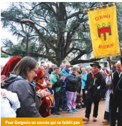
Pour Gergovia un succès qui ne faiblit pas