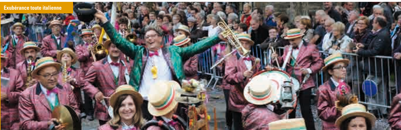
Exubérance toute italienne