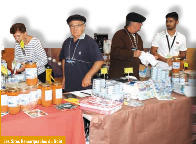
Les Sites Remarquables du Goût