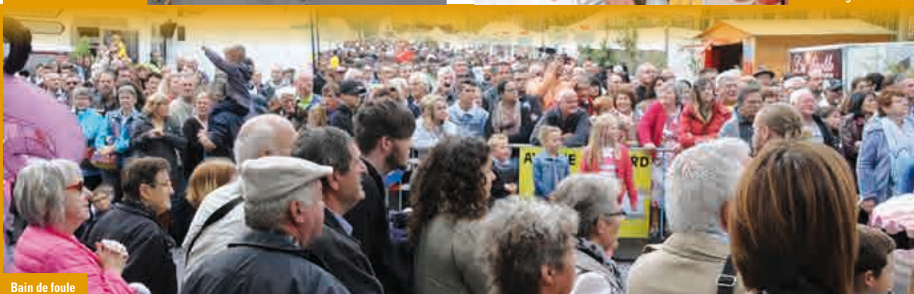
Bain de foule