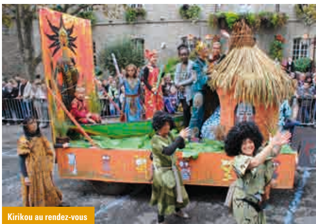
Kirikou au rendez-vous