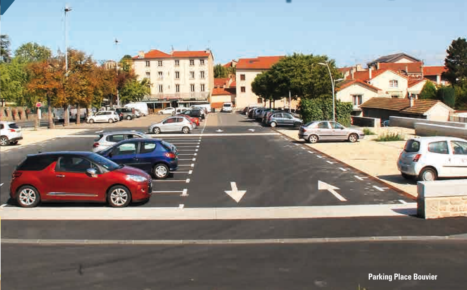
Parking Place Bouvier

La place Bouvier est emblématique de la question du stationnement prise à bras le corps. En la faisant passer de 75 à 118 places, avec une double borne de recharge pour les voitures électriques, la municipalité s'attache à préserver un juste équilibre entre toutes les formes de circulation en ville avec une priorité : permettre à celles et ceux qui passent la journée à Montbrison de stationner autour des boulevards pour réserver les places du centre ville, en zone bleue, aux consommateurs.