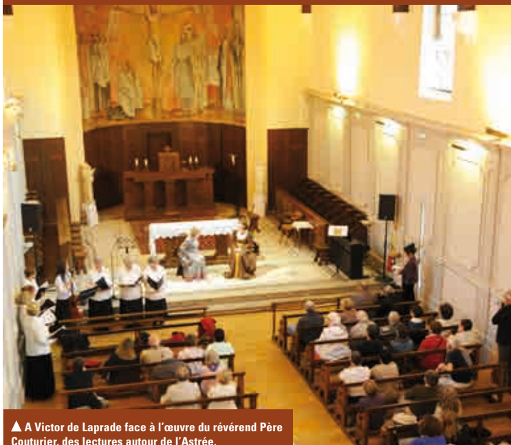
▲ A Victor de Laprade face à l'œuvre du révérend Père Couturier, des lectures autour de l'Astrée.