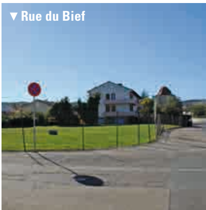
▼ Rue du Bief