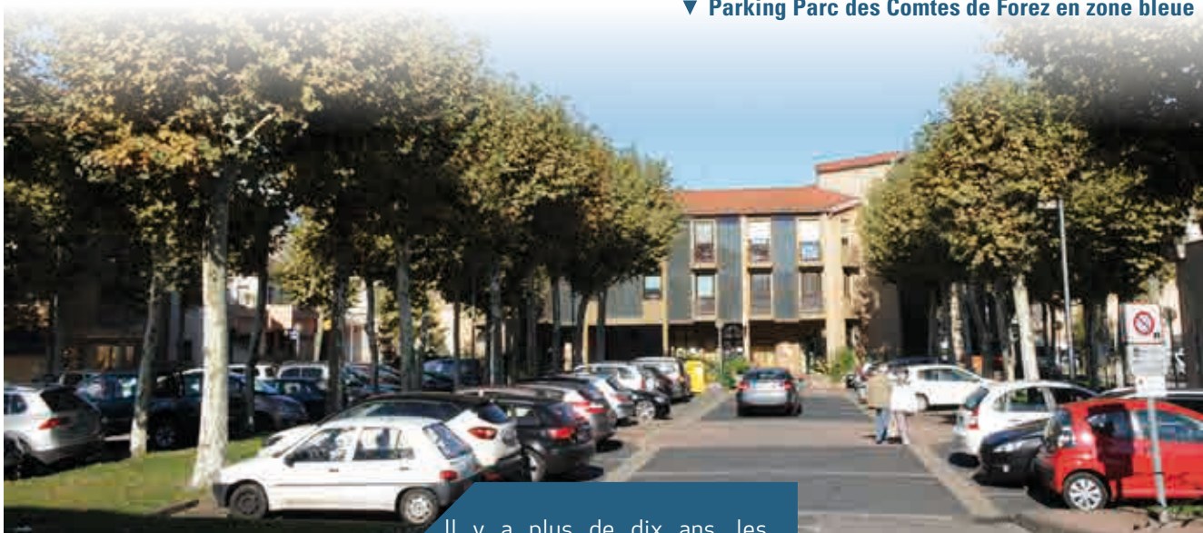
▼ Parking Parc des Comtes de Forez en zone bleue