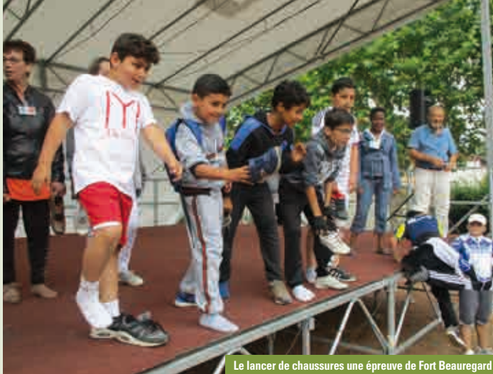
Le lancer de chaussures une épreuve de Fort Beauregard

En soirée, les festivités se sont poursuivies avec de la musique africaine, de la danse et le traditionnel feu d'artifice.