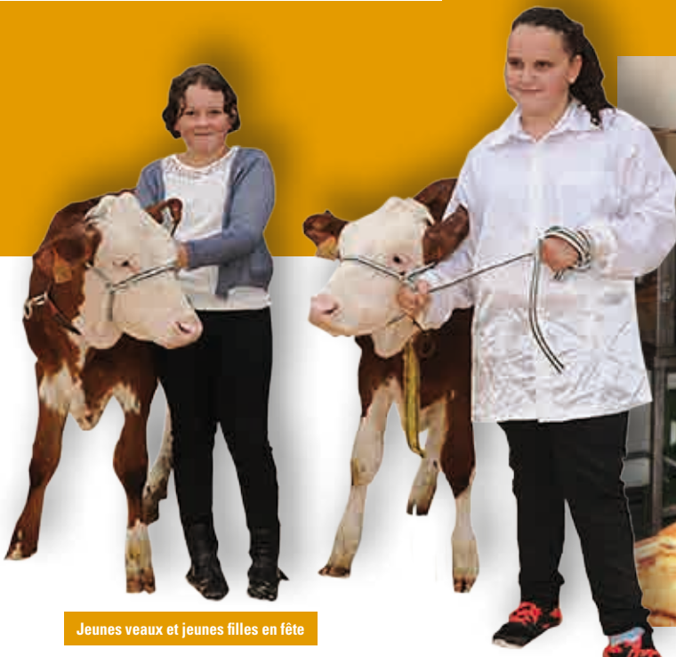
Jeunes veaux et jeunes filles en fête