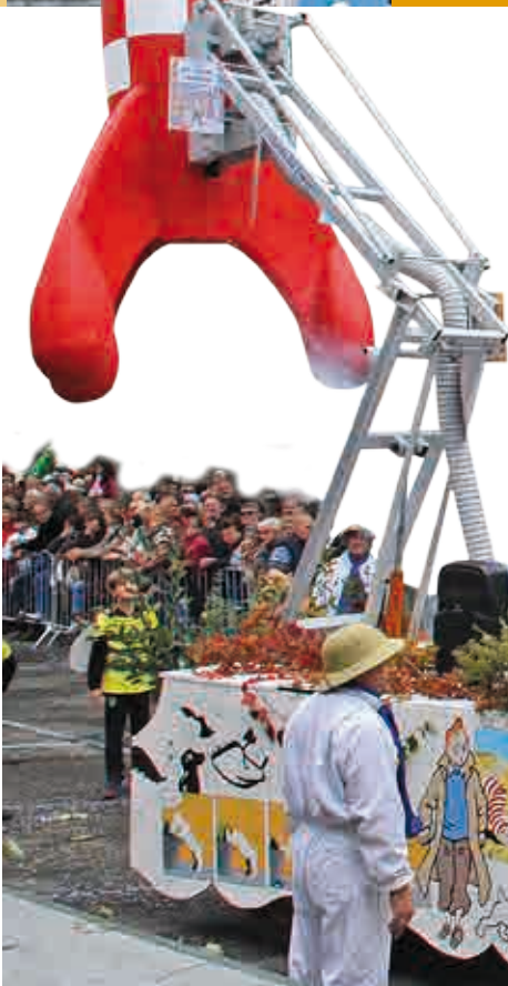
Tintin en route pour la lune revisité par l'abeille du Forez