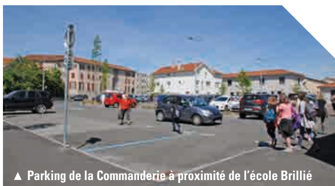
▲ Parking de la Commanderie à proximité de l'école Brillié

300 nouvelles places en trois ans. Tout en préservant l'évolution de part et d'autre de la mairie, l'offre de stationnement s'est trouvée chamboulée avec les travaux de la médiathèque et la nécessité de réaménager la place Eugène Baune de manière plus qualitative. Les travaux de la place de la Mairie qui vont commencer dès le début de l'année prochaine, permettront de conserver le même nombre de stationnement avec deux places supplémentaires pour les livraisons, sans parler des emplacements pour les personnes à mobilité réduite qui vont de soi à chaque rénovation.