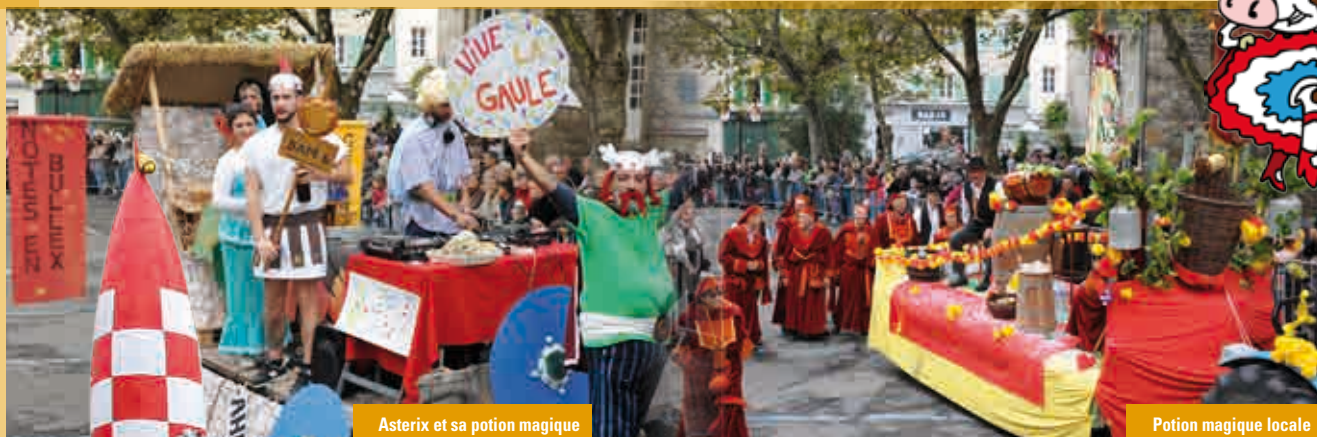
Asterix et sa potion magique