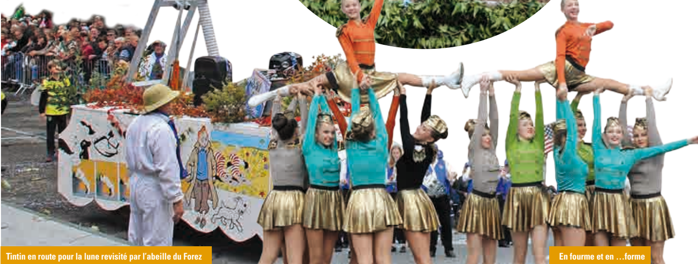
En fourme et en ...forme