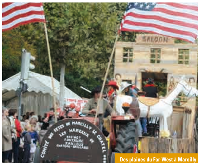
Des plaines du Far-West à Marcilly