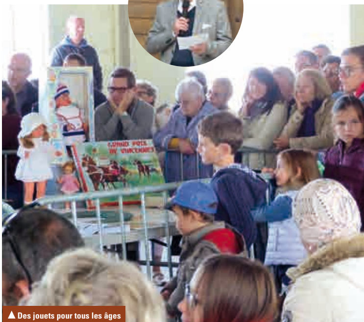
▲ Des jouets pour tous les âges