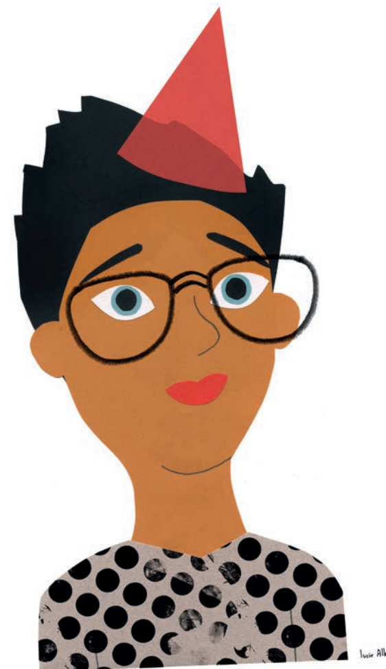
Illustration : Lucie Albon - Mise en page : Catherine Ormon - Impression : ICA