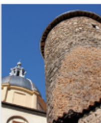
Tour de la barrière (p. 8)