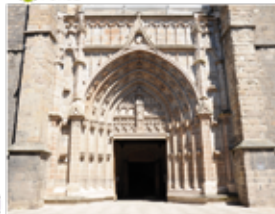
10 Collégiale (p. 3-16)