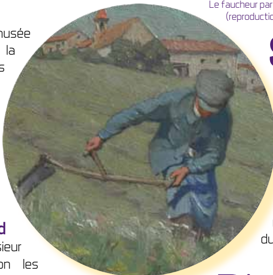
Le faucheur par Victor Guerrier (reproduction musée d'Allard).

C'est à partir de 1812 que le sieur d'Allard amène à Montbrison les visages du vaste monde. Le musée expose aujourd'hui les pièces les plus emblématiques de cette collection organisée suivant les règnes végétal, minéral et animal.