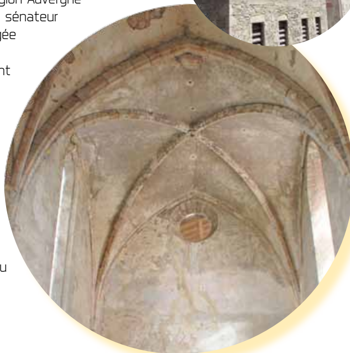
Les beaux arcs de croisées d'ogives de la chapelle médiévale et l'aumônerie