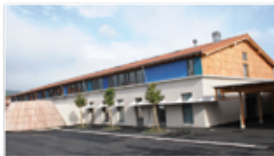
Nouvelle école Brillié (p. 19)