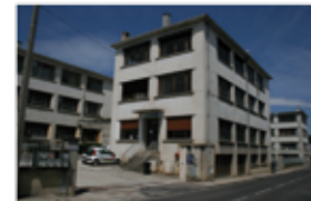
Ancienne usine GèGè (p. 17)