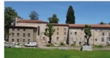
Clos Sainte-Eugénie (p. 4-5)