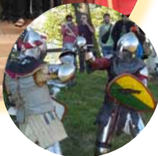
Les Amis de la colline du Calvaire, et les combattants de la compagnie médiévale d'Urfé