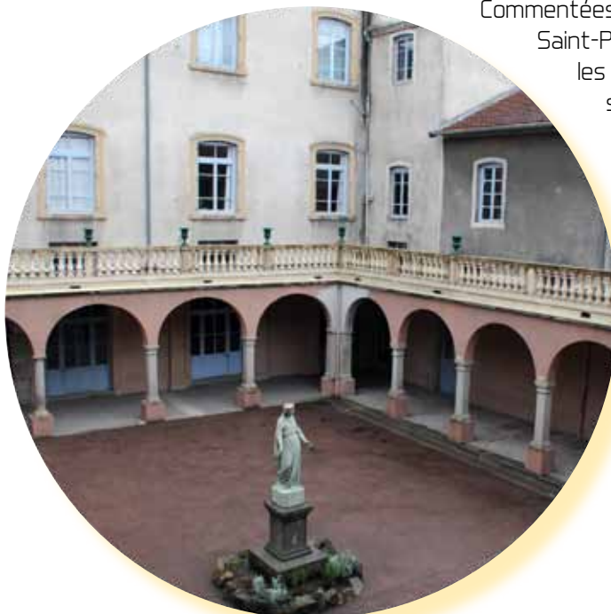
La cour intérieure du Collège Victor de Laprade

Les visites inviteront à la découverte de l'histoire de ces corps de bâtiments qui ont d'abord abrité un couvent de sœurs Ursulines de 1640 à 1789 puis un petit Séminaire de 1924 à 1968. Commentées par des élèves de première et terminale du lycée Saint-Paul-Forez qui ont choisi l'option Histoire des arts, les visites partiront du beau cloître resté intact pour se prolonger à l'intérieur de l'actuel collège Victor de Laprade puis dans la nef de la chapelle décorée par le dominicain Montbrisonnais Marie-Alain Couturier et illuminée par les magnifiques vitraux de l'Espagnol Francisco Borès !