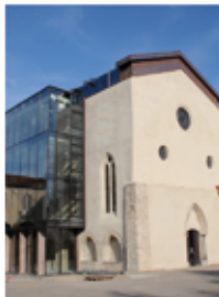
Médiathèque Loire Forez (p. 18)