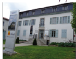
Musée d'Allard (p. 15)