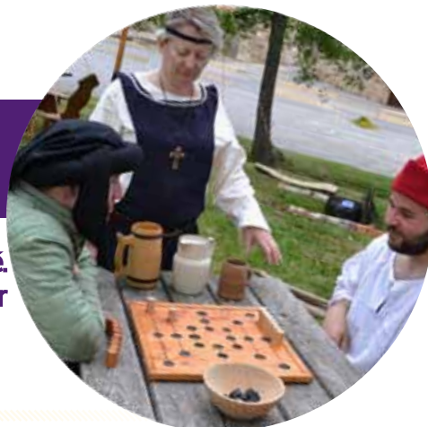
Nouvel espace de jeux de société

C ette année, un espace dédié aux jeux de société anciens sera organisé. Les enfants pourront s'exercer au jeu de quilles et à l'art de la joute sur poutre.