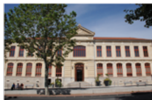
Communauté d'agglomération Loire Forez (p. 18)