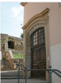
Collège Victor de Laprade (p. 12-13)