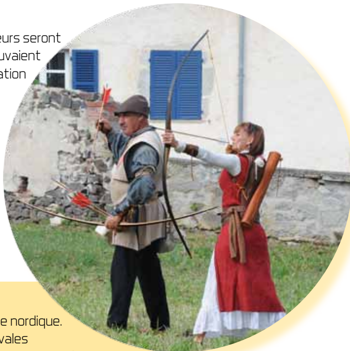
Les francs archers du Forez de retour au Calvaire.