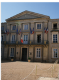
Sous-Préfecture (p. 14)