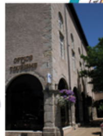
Maison du tourisme (p. 14-18)