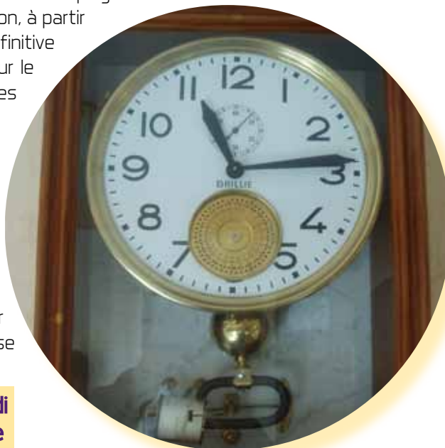
Horloge régulatrice à sonnerie.