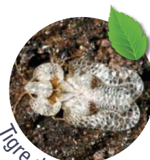
Tigre du platane