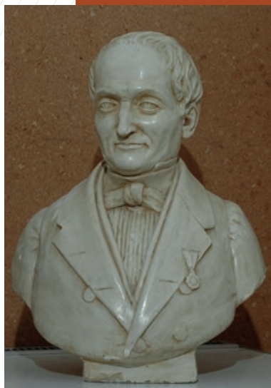
Buste de Jean-Baptiste d'Allard